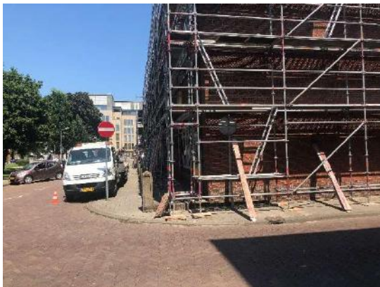
situatie die bijzonder onveilig is voor mensen met een visuele beperking

Wel is de steiger behoorlijk aangepast, zodat deze voldeed aan de wensen om steigerwerk af te schermen.