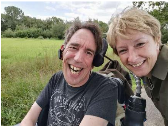
Niet alleen een advies maar ook sociaal contact na maanden binnen zitten