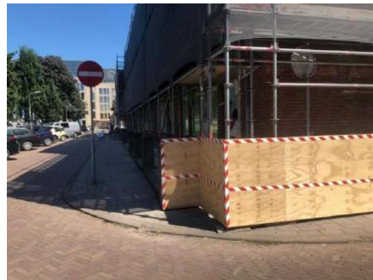
Na ons contact met de gemeente en de actie van de vergunningsambtenaar